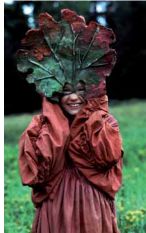
Die künstlerische Auseinandersetzung mit der Natur ermöglicht völlig neue Blickwinkel

gen Generationen den Zugang zu den Ressourcen zu ermöglichen, die sie zur Erfüllung ihrer Bedürfnisse benötigen. Oberstes Ziel ist es, die Kompetenzen zu fördern, die benötigt werden, um die komplexen Zusammenhänge zwischen der ökologischen, ökonomischen und sozialen Dimension nachhaltiger Entwicklung nachzuvollziehen und an Lösungen für heutige und künftige Probleme mitzuarbeiten. Dazu gehört auch, eigene Bedürfnisse und Lebensstile zu reflektieren und die Tragweite des eigenen Handelns in Bezug auf die Ziele nachhaltiger Entwicklung abschätzen zu können, um sich je nach Situation bewusst für oder aber auch gegen nachhaltiges Handeln entscheiden zu können.