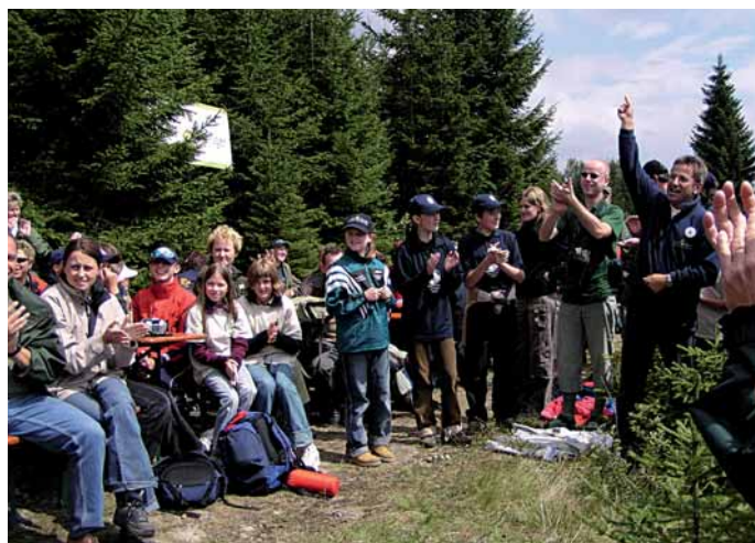
Bei den Jahresfesten der Junior Ranger stehen gemeinschaftliche Aktionen im Vordergrund

Ebenso wird die Zusammenarbeit mit der EUROPARC Federation, der europäischen Dachorganisation der Schutzgebiete, im Bildungsbereich fortgeführt.