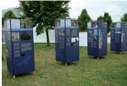
Zusammen mit dem Nationalpark Šumava wurde eine dreisprachige Ausstellung zur Biodiversität erarbeitet und u. a. 2008 in Bonn bei der UN-Konferenz präsentiert

Ein wichtiger Partner ist der Nationalpark Šumava (CZ). Die Kooperation ist durch das Memorandum über die Zusammenarbeit der beiden Nationalparke geregelt. Eine eigene bilaterale Arbeitsgruppe legt die konkreten Projekte fest. Schwerpunkt sind derzeit grenzüberschreitende Führungen, Jugendaustausch, deutsch-tschechisches Nationalpark Jugendforum, gemeinsame Dienste und Fortbildungsveranstaltungen der Nationalparkwacht und gemeinsame Projekte im Wildniscamp am Falkenstein und Jugendwaldheim. Darüber hinaus sollen auch die Projekte mit dem Nationalpark Sächsische Schweiz (z. B. jährlicher Schulklassenaustausch) fortgeführt werden.