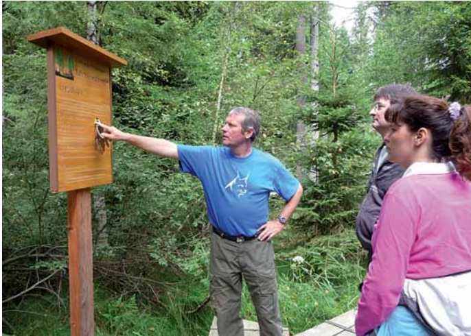
Die Waldführer, die in den Pro-Nationalpark-Vereinen organisiert sind, bringen jährlich vielen Besuchern die Besonderheiten des Nationalparks näher

engagieren möchten. Der Verein gliedert sich in mehrere Ortsgruppen und wird von ehrenamtlich tätigen Eltern geleitet. Die vielfältigen Aktivitäten des Vereins werden fachkundlich von Rangern der Nationalparkwacht begleitet.