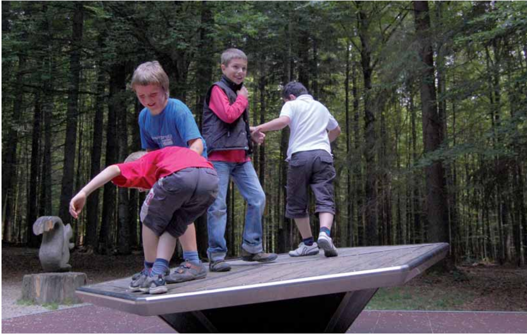
Im Waldspielgelände laden Geräte wie die Balancierscheibe zum gemeinschaftlichen Spielen ein

parkverwaltung bedürfen, soll sich aber mittelfristig in Teilen auch selbst organisieren.