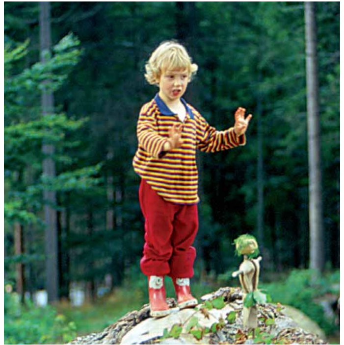
Ziemlich unbekümmert nähern sich Kinder erstmals der wilden Natur des Nationalparks

lung“ aus. Die Umsetzung dieser Dekade liegt bei der UNESCO, auf nationaler Ebene bei der Deutschen UNESCO Kommission, die in der Hamburger Erklärung (2003) erste Leitlinien definierte, die schließlich im „Nationalen Aktionsplan zur UN Dekade Bildung für nachhaltige Entwicklung“ (2005) konkretisiert wurden, der 2008 fortgeschrieben wurde.