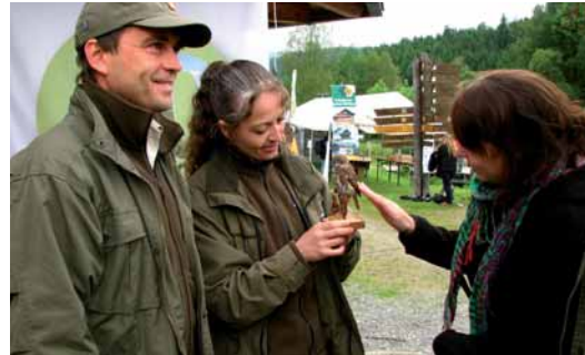
Naturgetreue Anschauungsobjekte wie ein ausgestopfter Sperlingskauz sind wertvolle Hilfsmittel bei der Wissensvermittlung