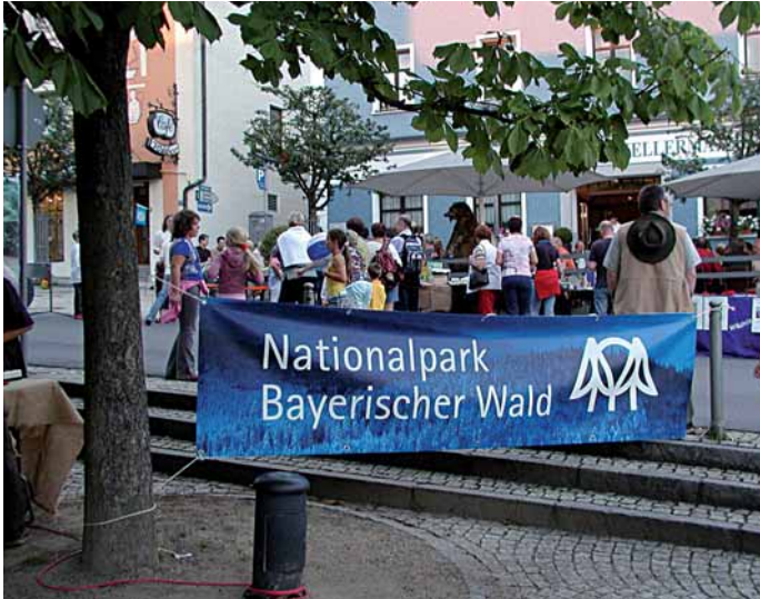
Mit der Präsentation des Nationalparks bei Veranstaltungen werden unterschiedlichste Zielgruppen erreicht