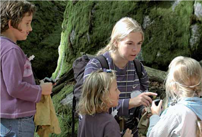
Beim Geräusch-Memory sind die Kinder voll konzentriert dabei