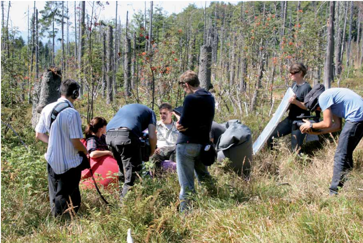
Der Nationalpark Bayerischer Wald ist oft begehrtes Objekt für überregionale Medien