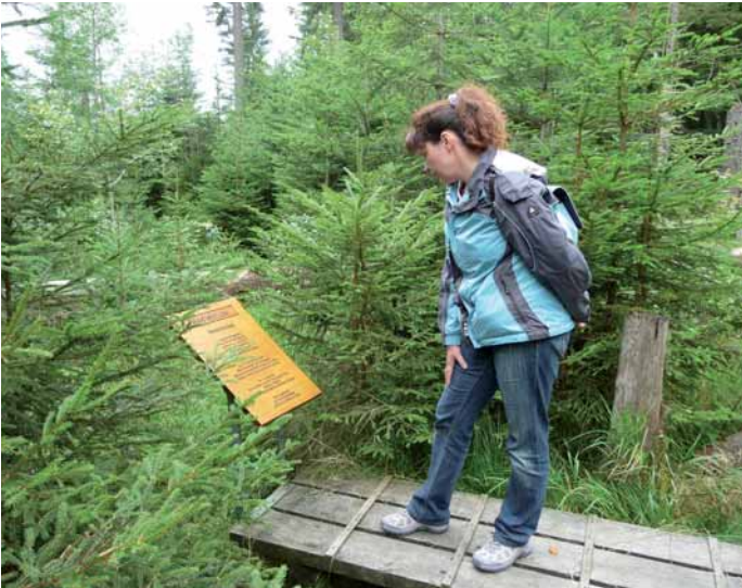
Die Texttafeln am Seelensteig laden zum Besinnen und Verweilen ein