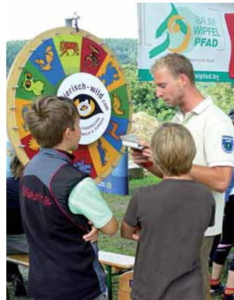
Auf spielerische Art die Natur zu entdecken, kommt besonders bei Kindern und Jugendlichen gut an