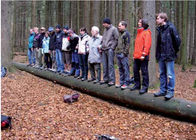
Die direkte Naturerfahrung ist ein zentrales Element in der Ausbildung der angehenden Waldführer